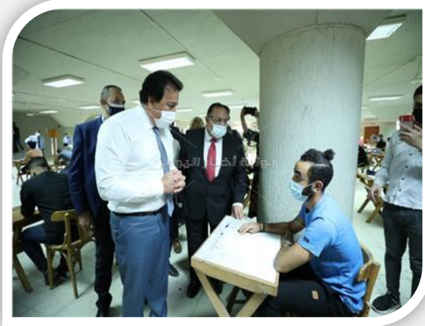
د. خالد عبد الغفار وزير التعليم