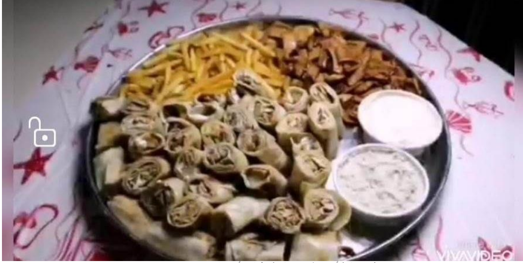
تنظيم مسابقة أحسن شيف بجامعة حلوان "أون لاين"

نظمت أسرة من أجل مصر المركزية مسابقة أحسن شيف أونلاين لطلاب جامعة حلوان وذلك تحت رعاية الدكتور ماجد نجم رئيس الجامعة والدكتور حسام رفاعي القائم بعمل نائب رئيس الجامعة لشئون التعليم والطلاب .