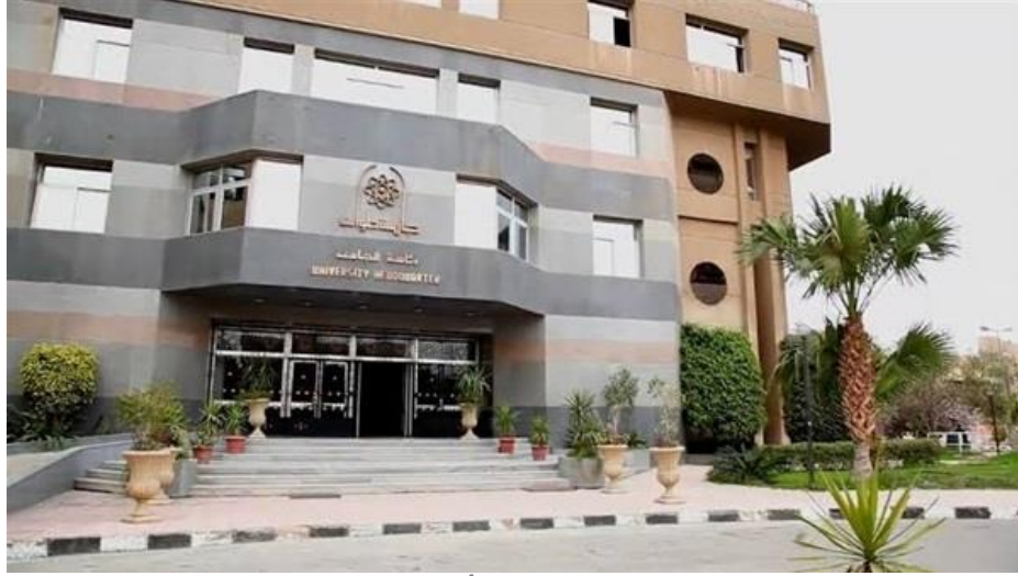
جامعة حلوان - أرشيفية

نظمت أسرة من أجل مصر المركزية مسابقة أحسن شيف أونلاين لطلاب جامعة حلوان، وذلك تحت رعاية الأستاذ الدكتور ماجد نجم رئيس الجامعة وريادة الأستاذ الدكتور حسام رفاعي القائم بعمل نائب رئيس الجامعة لشئون التعليم والطلاب.