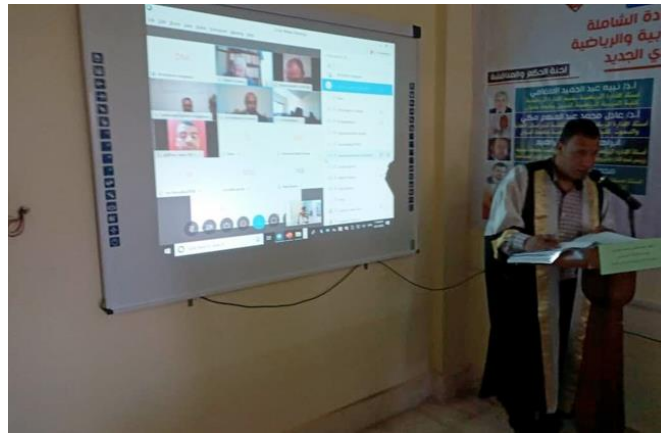
رسالة ماجستير عبر شبكة الفيديو كونفرانس