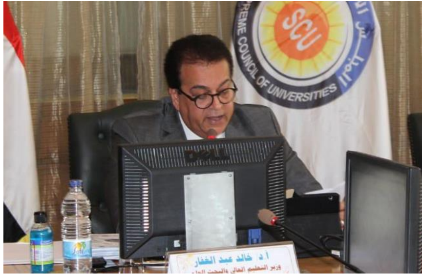
الدكتور خالد عبدالغفار، وزير التعليم العالي