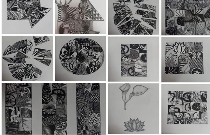
إبداعات طلاب "التربية الفنية" بحلوان