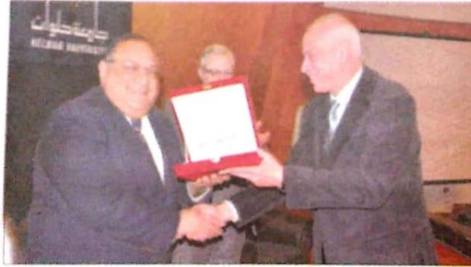
■ جانب من تكريم جامعة حلوان لباحثيها

تقيم الجامعة وقادتها الدعم الكامل للباحثين وللنشر العلمي الدولي