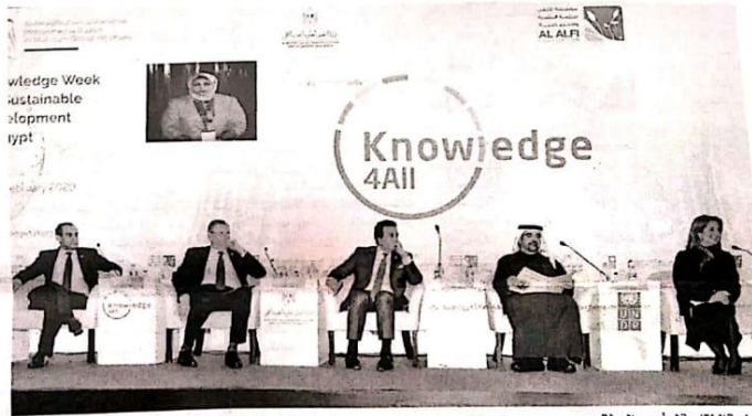
الجلسة الختامية لـ «أسبوع المعرفة».

على علوم البيانات، فى سياق متصل، انتهت، أمس، فعاليات أسبوع المعرفة لتحقيق التنمية المستدامة فى مصر، والذي نظمه برنامج الأمم المتحدة الإنمائي، ومؤسسة محمد بن راشد آل مكتوم للمعرفة، بالتعاون مع وزارة التعليم العالى والبحث العلمى. وقرر وزير التعليم العالى والبحث العلمى، تكوين مجلس أعلى للمعرفة من عمداء الكليات ذات الصلة، يبتقى منه هيئة المعرفة مكونة من الشباب المشاركون فى هذا الأسبوع، يكون مسئولاً بالاشتراك مع المجلس الأعلى للمعرفة عن وضع مقترح لاستراتيجية بناء مجتمع المعرفة المصرى. وأكد الوزير، أنه بفضل العمل المستمر مع مشروع المعرفة العالمى، حققت مصر تقدماً ملحوظاً فى التعليم العالى، حيث ساهم التعاون فى تقدم مصر ١٧ مرتبة محصلة المركز ٤٩ عالمياً. ويصنف مؤشر المعرفة العالمى ٢٠١٩ مصر فى المرتبة ٨٢ من أصل ١٢٦ دولة، حيث تقدمت ١٧ مرتبة، محققة تقدماً ملحوظاً فى التعليم قبل الجامعى، كما حافظت على ترتيبها المتقدم على مستوى الالتحاق بالتعليم العالى، محققة المرتبة ١١ من أصل ١٢٦ دولة. من جانبه قال المدير التقني لمؤسسة محمد بن راشد آل مكتوم للمعرفة جمال بن حويرب: إن مبادرة أسبوع المعرفة تستهدف الشباب فى قيادة مسيرة البناء والتنمية، مضياً أن «مؤشر المعرفة العالمى يقيس طرقاً للتنمية المستدامة للمجتمعات،