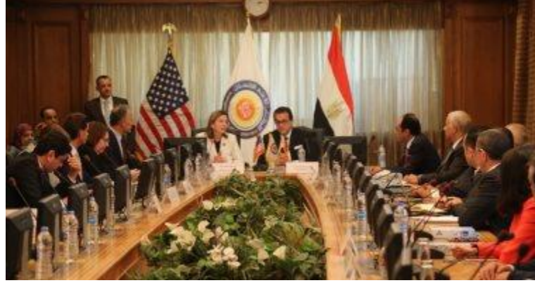
كتب محمد صبحى

استقبل الدكتور خالد عبد الغفار وزير التعليم العالى والبحث العلمى مساء اليوم الثلاثاء مارى رويس مساعد وزير الخارجية الأمريكية للشئون التعليمية والثقافية، وجوناثان كوهين السفير الأمريكى بالقاهرة والوفد المرافق لهما، وذلك بمقر المجلس الأعلى للجامعات.