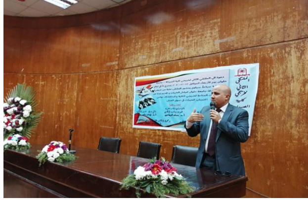
جانب من الملتقى