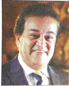
د. خالد عبد الغفار

والجلالة والعلمين والمنصورة الجديدة، موجها بضرورة الانتهاء من كافة التجهيزات في أقرب وقت ممكن، تنفيذًا لخطة الوزارة في التوسع في إنشاء الجامعات وإتاحة التعليم العالي، وحتى تصبح الجامعات جاهزة لاستقبال الطلاب في العام الدراسي الجامعي المقبل.. وأكد د. خالد عبد الغفار على أهمية متابعة العمل لضمان تنفيذ المشروعات التعليمية الجديدة طبقاً لأعلى المواصفات الفنية، مع التأكيد على توافر متطلبات العملية التعليمية شاملة المباني التعليمية، والمعامل البحثية، وتوفير الإمكانات اللازمة لممارسة الأنشطة الطلابية المختلفة.