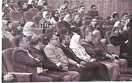
جانب من الندوات الجامعية للتوعية بفيروس كورونا

وأكدت التقرير أن المستشفى الجامعي لجامعة قناة السويس نظم ندوة تثقيفية حول فيروس كورونا، بقاعة المؤتمرات الكبرى بالمستشفى الجامعي. كما نظمت كلية الطب البيطري جامعة المنوفية ندوة تثقيفية وتوعوية بعنوان «فيروس كورونا وكيفية الوقاية منه».