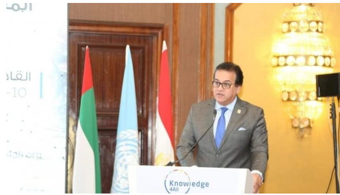
الدكتور خالد عبدالغفار وزير التعليم العالي

استقبل الدكتور ماجد نجم رئيس جامعة حلوان، اليوم، الدكتور خالد عبدالغفار وزير التعليم العالي والبحث العلمي، والدكتور حسين بن إبراهيم الحمادي وزير التربية والتعليم الإماراتي، وذلك خلال زيارة لكليات جامعة حلوان الفنية بالزمالك.