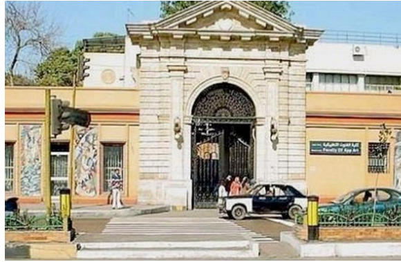
كلية الفنون التطبيقية بجامعة حلوان