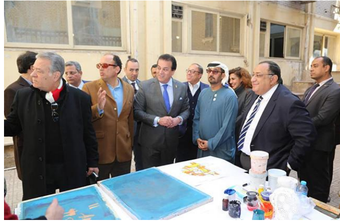
وزير التعليم العالي ونظيره الاماراتي في زيارة جامعة حلوان