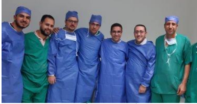
فريق طبي جامعة حلوان

فريق طبي بجامعة حلوان ينجح فى إجراء عملية معقدة لطفل بعد قطع عضلات المرئ الأربعاء، ٠٨ يناير ٢٠٢٠ ٢١:١١ ص