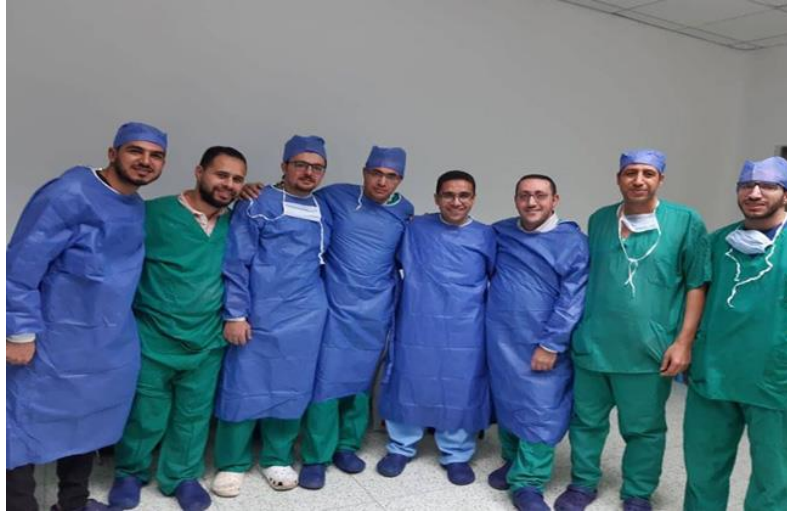
الفريق الطبي بجامعة حلوان