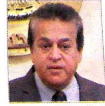
د. خالد عبدالغفار

أعلن د. خالد عبدالغفار وزير التعليم العالي عن إطلاق مبادرة لتطوير أقسام الطوارئ في جميع المستشفيات الجامعية على مستوى الجمهورية، تم تخصيص ٥٠٠ مليون جنيه كمرحلة أولى للبدء في هذا التطوير الشامل لتلك الأقسام. جاء ذلك خلال تفقده أمس مستشفيات جامعة بنها، حيث أشاد بالأداء المتميز للأطباء والفريق الفني المساعد من أطقم التمريض والإداريين، كما أعلن عن تخصيص مبلغ ٢٠٠ مليون جنيه من المبادرة المصرية اليابانية والإدارة المركزية للبعثات والتمثيل الثقافي بالوزارة بالتعاون مع البنوك لتدريب الأطباء والفرق الفنية المتميزة من أطقم التمريض والإداريين للتدريب