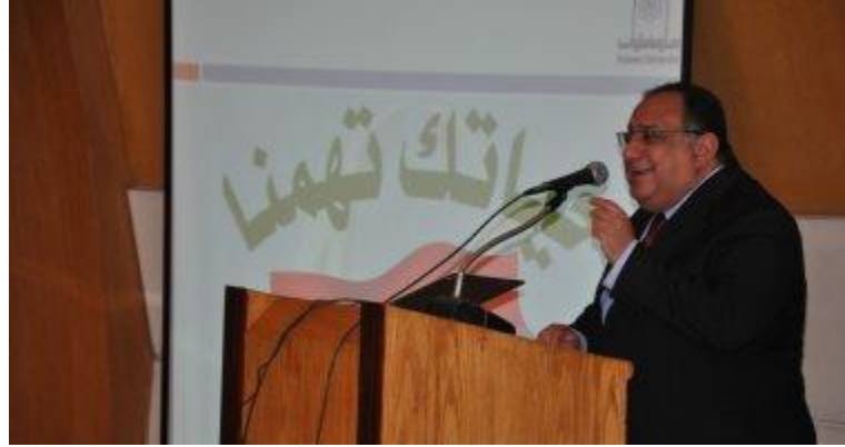
الدكتور ماجد نجم رئيس جامعة حلوان