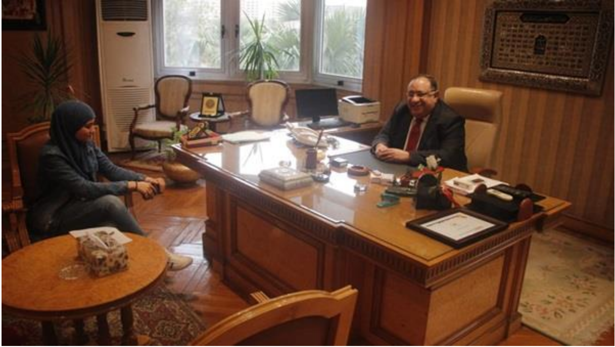
رئيس جامعة حلوان