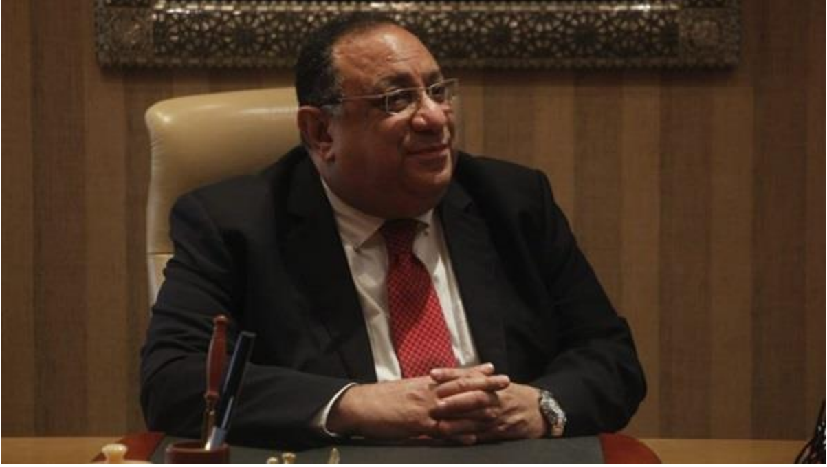
رئيس جامعة حلوان