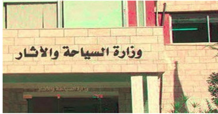
وزارة السياحة و الآثار