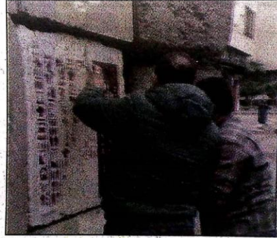
■ جانب من تجميل الحوائط الخرسانية

المصرية القديمة بطريقة فنية بكل ما تحمله من أصول فنية ومعان رمزية وتعبيرية، بأسلوب فني حديث. يذكر أن عدد المومياوات والتوابيت التي سيتم نقلها يبلغ ٢٢ مومياء ملكية و١٧ تابوتا ملكيا، ترجع إلى عصر الأسر ١٧، و١٨، و١٩، و٢٠، من بينهم ١٨ مومياء للوك و٤ مومياوات للمكات، منهم مومياء الملك رمسيس الثانى والملك سقن رع، والملك حتشمس الثالث، والملك ستى الأول، والملكة حتشبسوت، والملكة ميرت أمون زوجة الملك امنحتب الأول، والملكة أحمس نفرتارى.