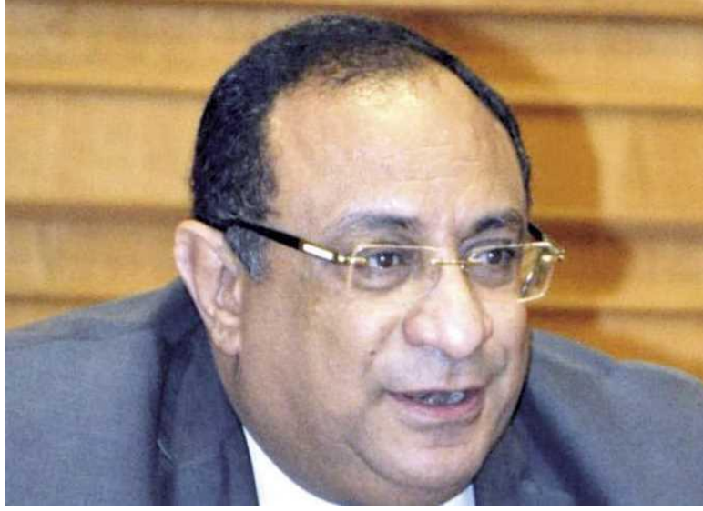
الدكتور ماجد نجم رئيس جامعة حلوان

أعلن الدكتور ماجد نجم رئيس جامعة حلوان، عن تنظيم أول مسابقة من نوعها لاختيار أفضل برنامج تعليمي جديد على مستوى البكالوريوس والدراسات العليا بالجامعة، وذلك بهدف تحقيق جودة العملية التعليمية.