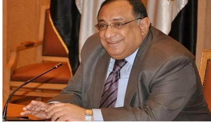
الدكتور ماجد نجم رئيس جامعة حلوان