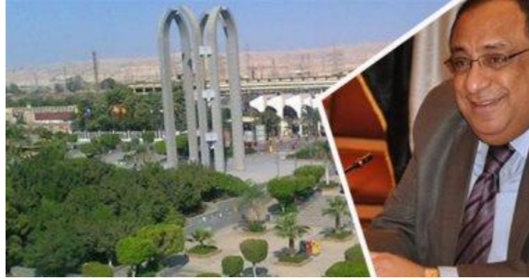
الدكتور ماجد نجم رئيس جامعة حلوان