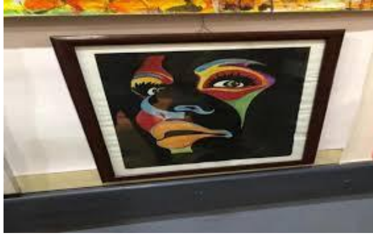
الملتقى الدولي للفنون التشكيلية