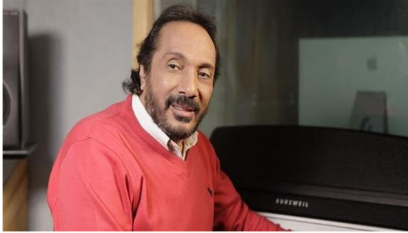
النجم علي الحجار